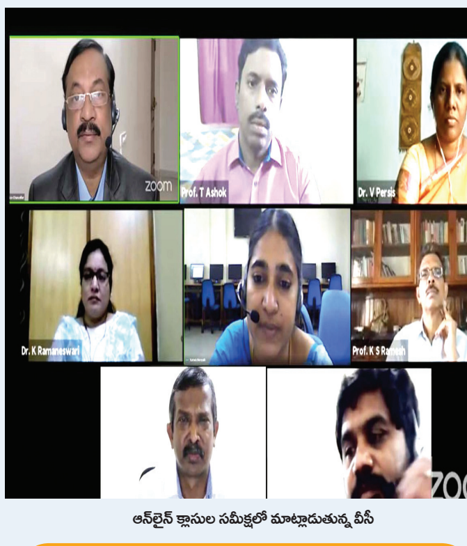
ఆన్లైన్ క్లాసుల సమీక్షలో మాట్లాడుతున్న వీసీ