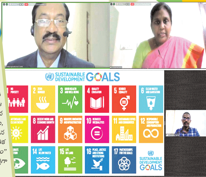
వెబినార్ లో మాట్లాడుతున్న వీసీ జగన్నాథరావు

ఇదీ ప్రకృతి చేస్తున్న వికృత హేష మీద నేటి పత్రికల ఘోష!!!